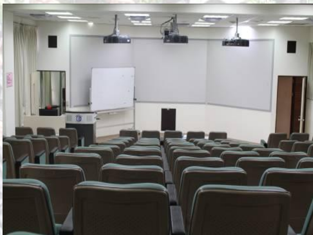
1. 涵德 1F 產業職能數位情境模擬實驗室