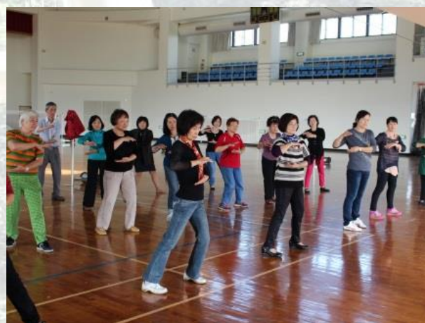
6. 健心 3F 多功能運動場