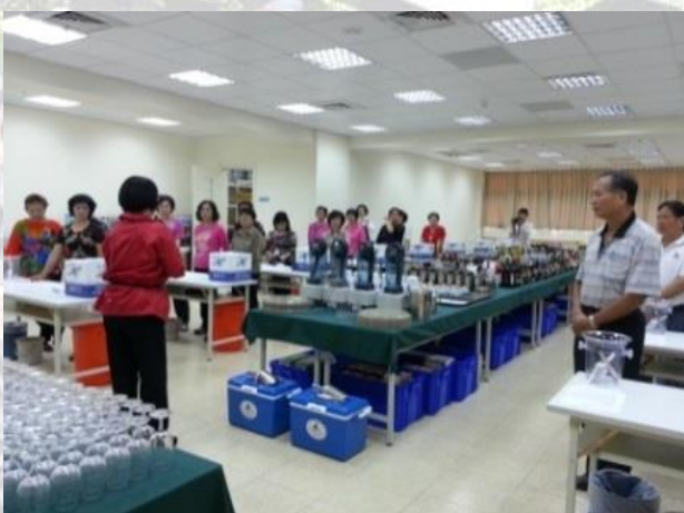
7. 健心 2F 飲料調製專業教室