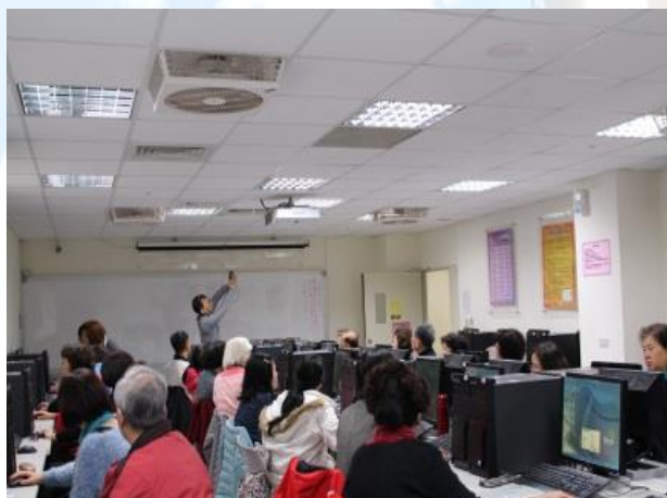
3. 涵德 B1 觀光與休閒資訊電腦教室