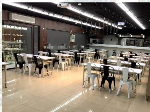
5. 學以軒 B001 餐飲健康輕食實驗教室