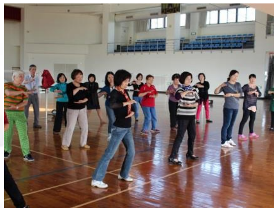
6. 健心 3F 多功能運動場