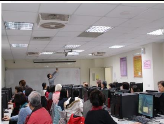
3. 涵德 B1 觀光與休閒資訊電腦教室