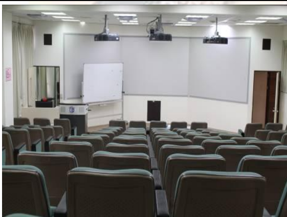
1. 涵德 1F 產業職能數位情境模擬實驗室