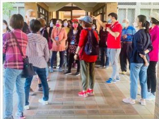
畢業典禮後於上學樓連誼社區社團