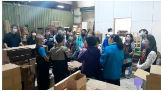
新竹縣中小企業經營發展協會與會聯發科總經理人蔣林副總經理與中興科大師生合影