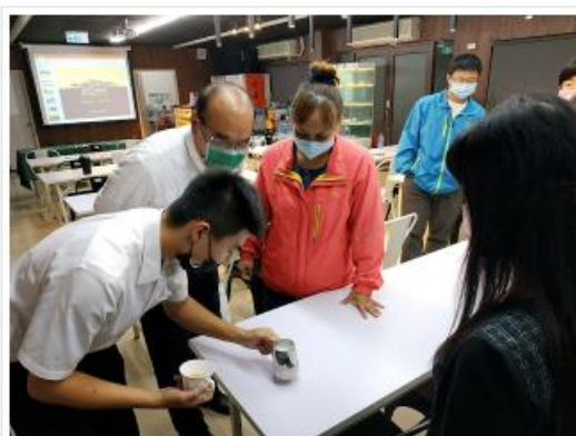
該系系友蒞臨青島講座並與該系系友進行研討會