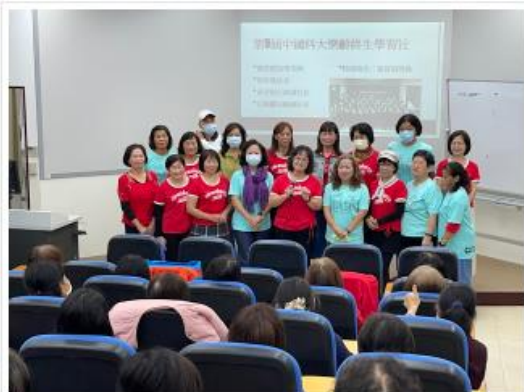
第12屆終生學習社活動成果展