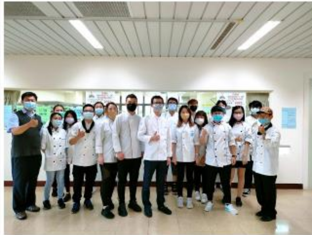
觀管系烘焙班全體師生合照

藉由本次比賽，學生們也學到許多烘焙方面的專業知能，雖然創意是現在的學生最缺乏的，但是技術是需要時間慢慢淬鍊與熟成，期許每位選手能繼續走在烘焙這條路上，希望未來能不斷超越現在的自己。