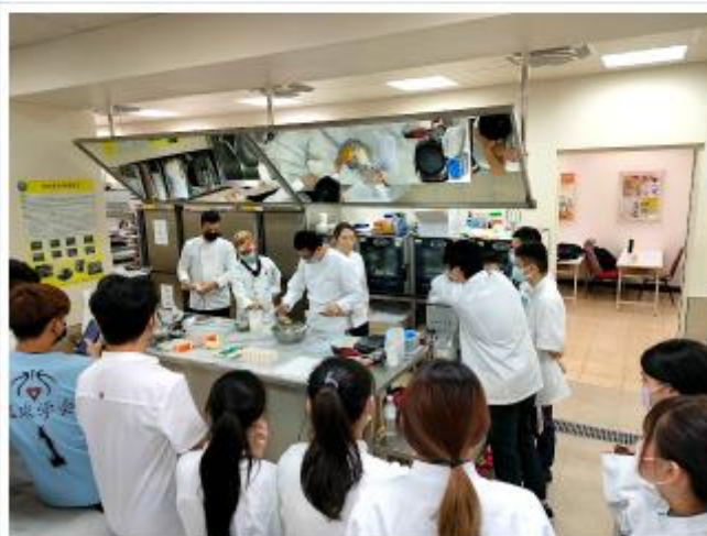
觀管系學生在烘焙教室練習