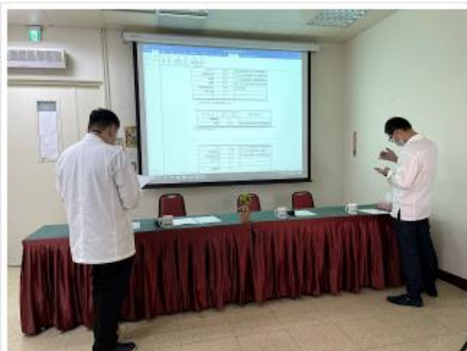
評審針對選手作品影片進行線上講評