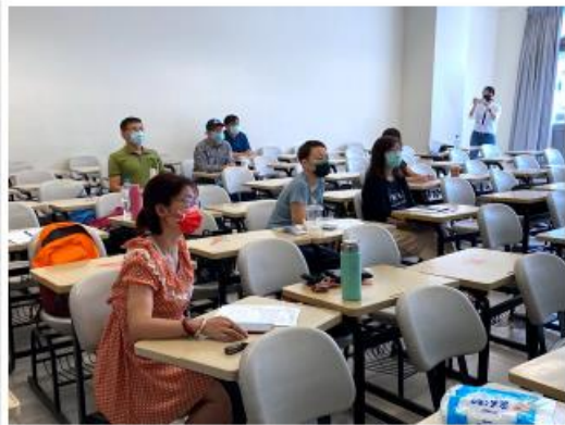
該系系友蒞臨青島講座