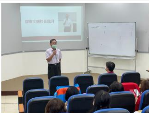
康寧文學院校長致詞第12屆樂大友誼