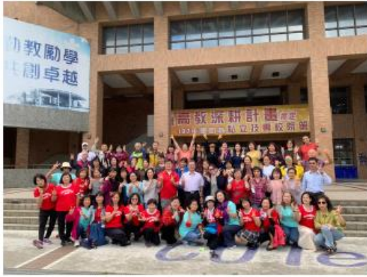
中興科大第12屆畢業典禮合照