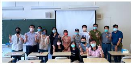
中華地理山溪河社產業協會成立開幕典禮 (左二) 與該系系友成立合照