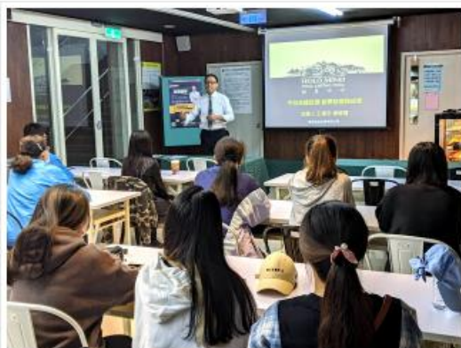
該系系友蒞臨青島講座並與該系系友進行研討會