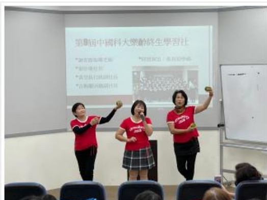
康寧文學院轉職局員工上學樓