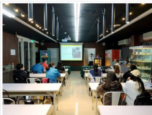
該系系友蒞臨青島講座並與該系系友進行研討會