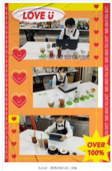
咖啡館 - 酒類試飲器材組裝完成