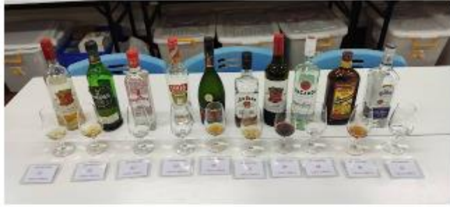
酒類試飲器材組裝