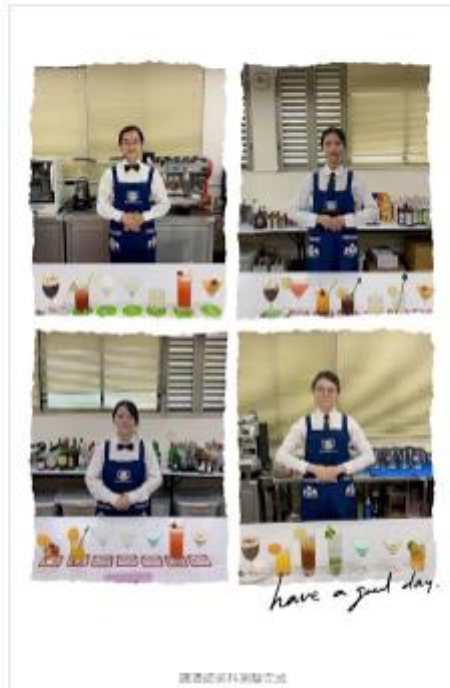
酒類試飲器材組裝完成