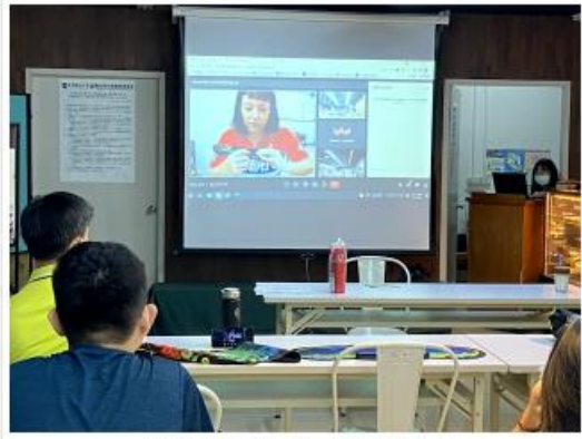
中華製冰協會製冰師培訓海峽區C級製冰師培訓課上線開課