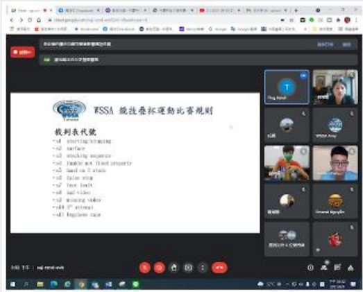
C級製冰師培訓規則介紹