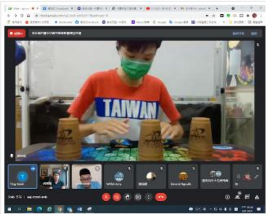
C級製冰師培訓實作列空練習