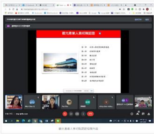
觀光產業人員初階認證課程內容