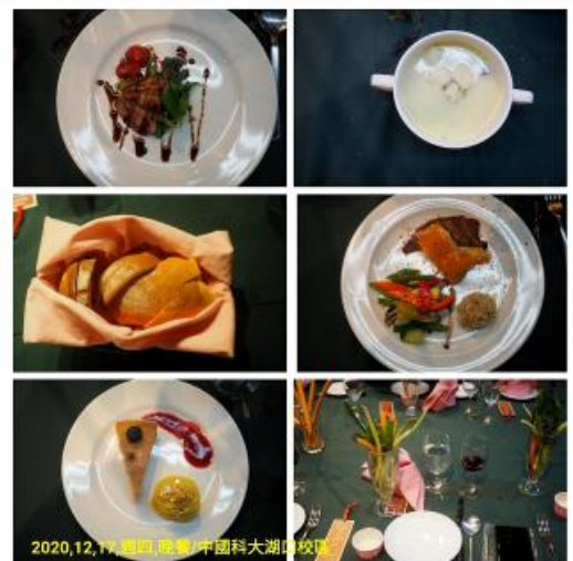
2020,12,17,週四,晚餐,中國科大湖山校區