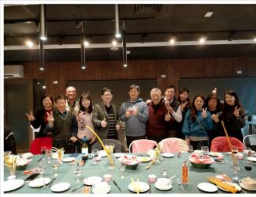
桃園市社會青年服務團、弘道園美侖文小協會以及桃園市弘道園美侖文小協會多興餐廳之家庭公益活動