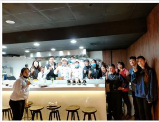
多興餐廳與社會公益團體弘道園美侖文小協會之公益活動