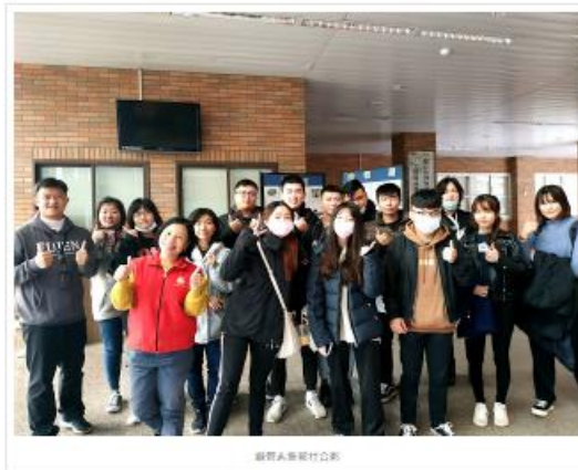
觀管系新進竹合影