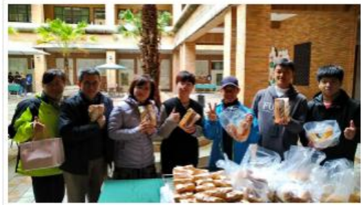
第4項學菜以用英國雙餅-A層夾心，討得銷售額最高「雙皮奶茶」愛心滿意產品