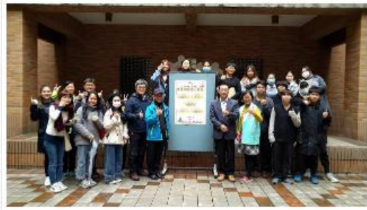
頒發與家醫教育中心代表合影