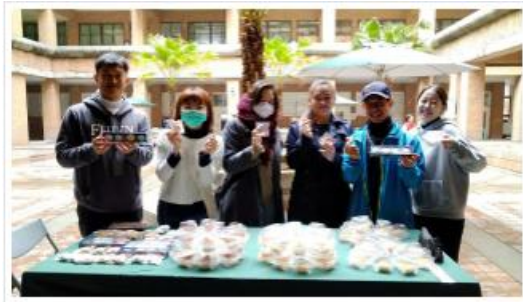
第1項由頂仔村農會3A級的凡爾登系列製作「香乳烏香捲」、「櫻桃米糕」及「法式馬卡龍」心滿意產品