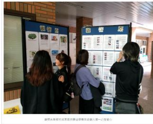
觀管系新進竹北東區共舞運動會及企業人第一屆會心