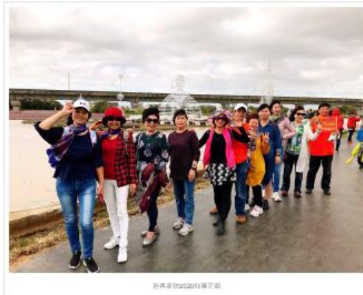
公共管理課程2020年成果照