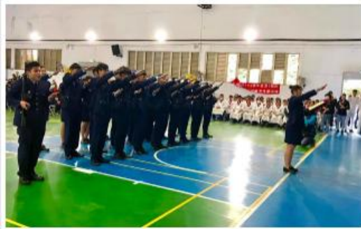
國澳高中華軍保潔隊訓練隊員自編儀式