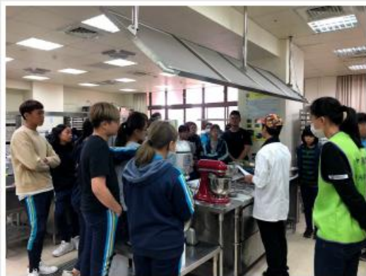
駐德和警進行烹飪訓練