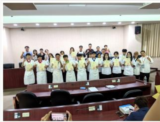
2020全國田徑錦標賽「超馬」組，聯賽領獎