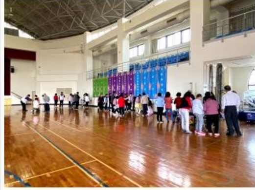
華新大學配合各項測評活動