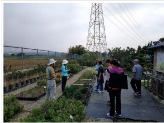
新美村富源區行健路行健路新設