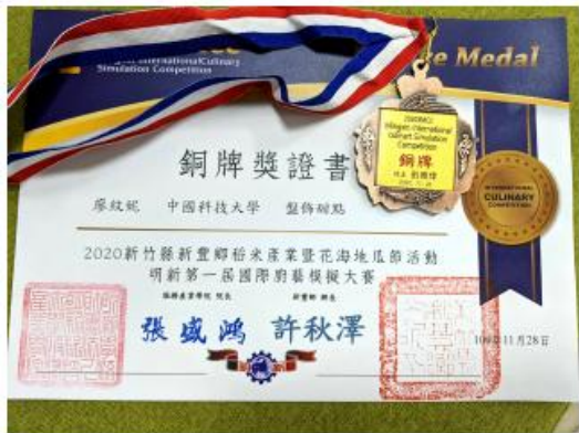
全國大賽「雙龍點心」獲得銅牌證書得獎牌