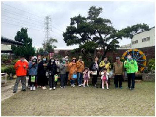
新美村富源區展覽區展覽區