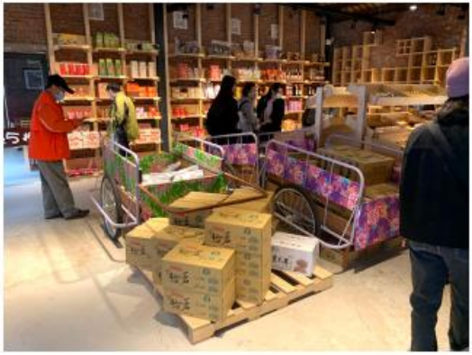
新美村富源區市場區展覽區早鮮