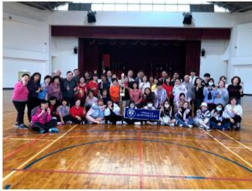
華新大學全體師生與體育系同仁全體合照