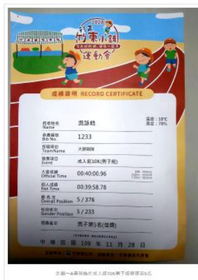
景觀—A樂活族於成人組100(男子組)第5名