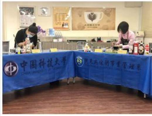
2020 ISS-Chinese全國田徑錦標賽聯賽領獎