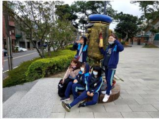
仰德高中軍警科師生與國防部官員合影開訓