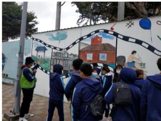
國科大學小龍潭場站協助小龍潭場