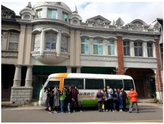
新美村富源區展覽古早的白粉