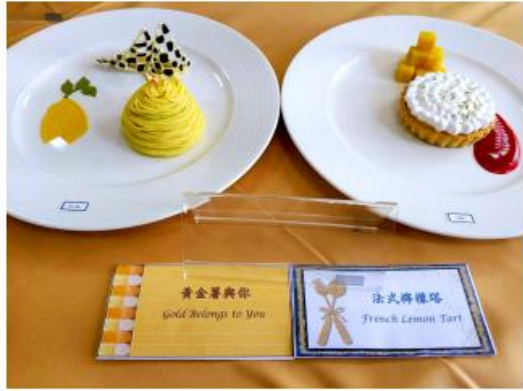
廚藝系副系主任陳「黃金薯筒形」與「法式檸檬塔」作品參賽的作品