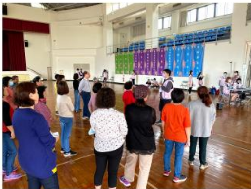
體育室 歐陽永隆副院長蒞臨指導華新大學進行各項測評活動