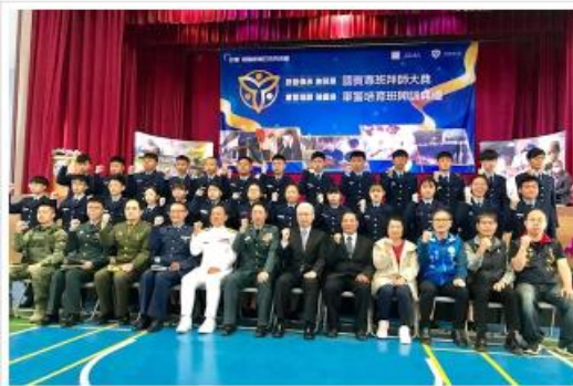
聯合宣誓與國澳高中華軍保潔隊合照