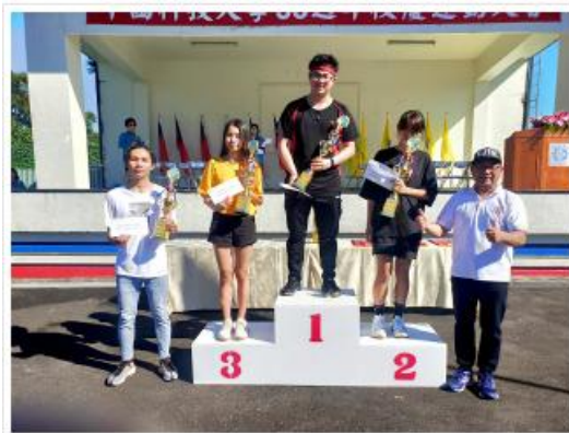
台北縣區田徑平松慶賀賽領獎