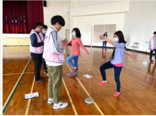
進行2分鐘測評活動