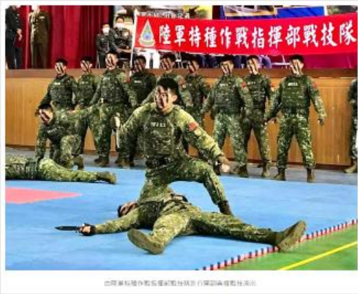
陸軍特種作戰指揮部戰技隊進行保潔隊戰術訓練