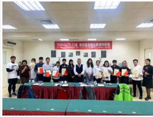
2020-GUTE 03 第四屆全國校際田徑聯賽領獎