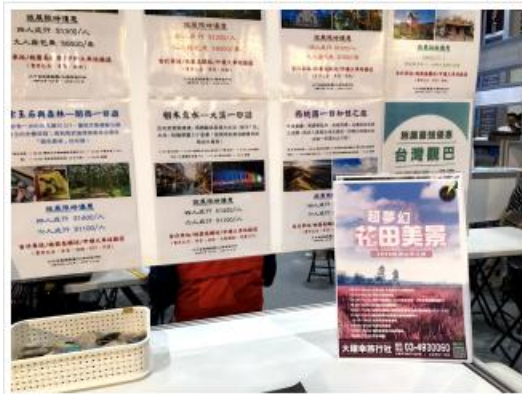
2021台灣鮮果花展特展上廳展覽板展示