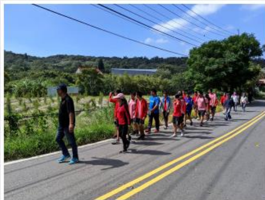
由農委會派員及湖口高中師生於湖口鎮行導覽解說