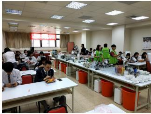
參加觀光系舉辦小研會攝影合照