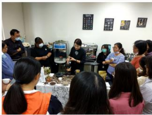
新竹國科中心資訊中心製作