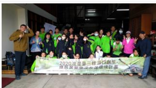
中興科大、湖口國中師生於中興偉人山莊合照