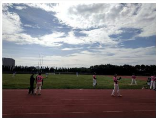
於中國科大新竹校園區田徑場比賽