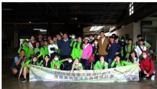
湖口國中師生於湖口鎮安泰戲院舉行攝影展合照