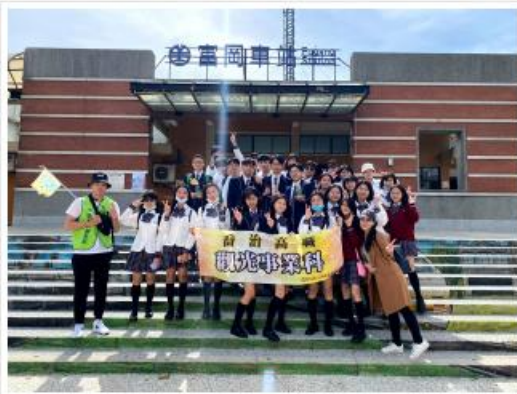
於校園內與觀光系高職小學之團體合照並合影合照