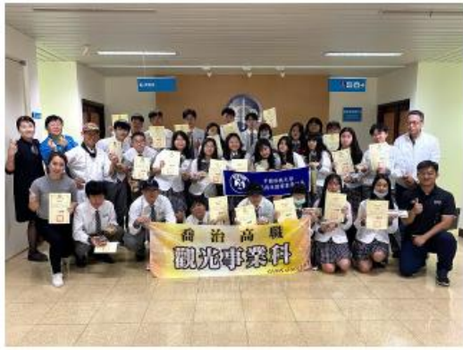
獲得政府頒發之全國首屆觀光事業科證書