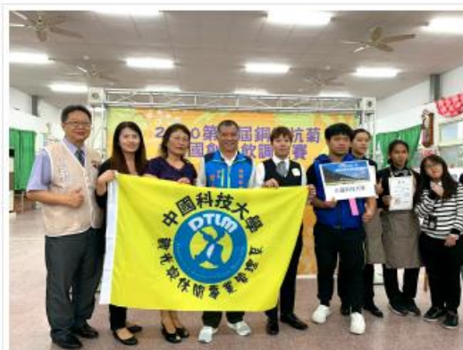
臺灣科技大學所屬新開天訂酒師 (右4) 合影