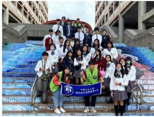
於觀光系學生會辦公室團體合照合照