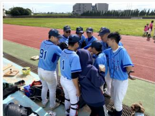
中國科大在校女棒隊行山重新加裝打擊