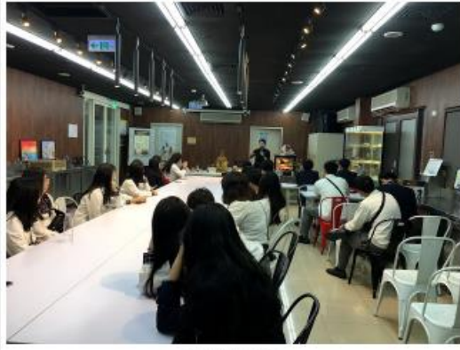
參加觀光系舉辦以研習會合照