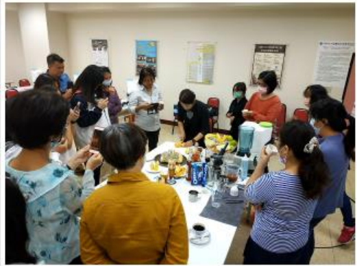
新竹國科中心資訊中心製作