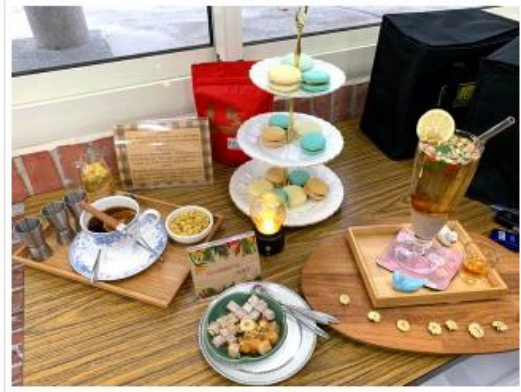
中國科大「美味下午茶」之蘇式作品