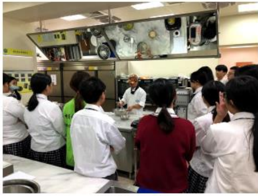
附設心經烘焙教室與自然科學實驗室