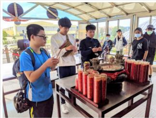
人機聯合研習會 - 歐亞水務中心