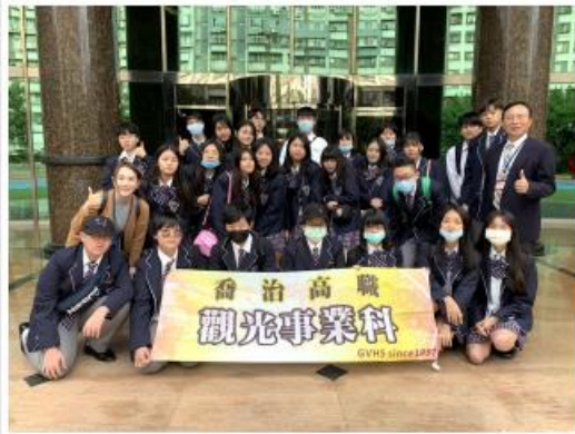
臺北縣立海山高級中學與中國文化大學觀光系行政安全講習會合照