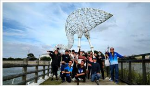
歐亞水務研究中心 - 歐亞水務