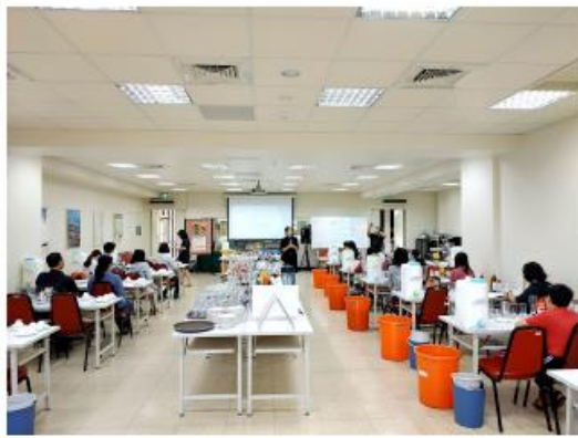
新竹國科中心製作