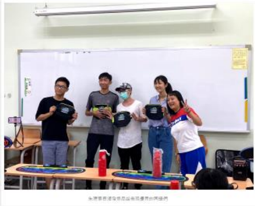
台灣社會服務與社區發展中心與台灣社會服務中心合作