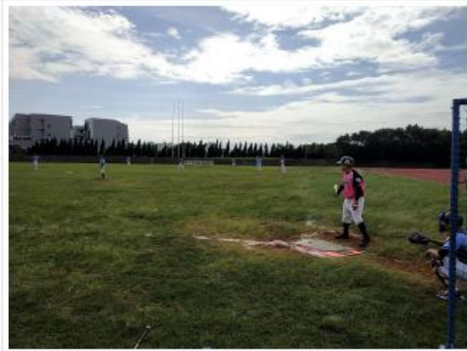
於新竹校園區田徑場比賽，由JFC俱樂部女隊先攻