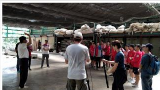
湖口高中師生於湖口鎮茶廠參觀紀錄