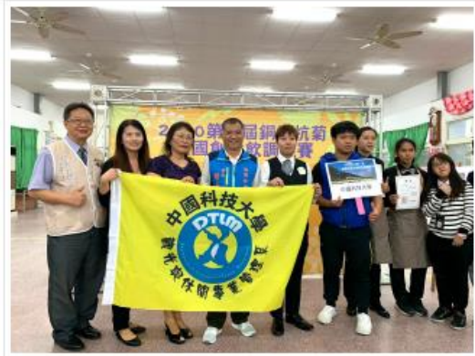
香港科技大學與香港聯合總會攜手合作 (右4) 合照