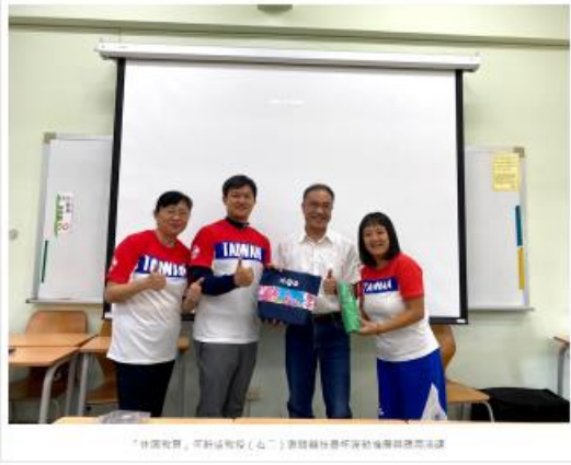
「休閒教育、活動與科技(五)」邀請輔仁大學社會服務與社區發展中心