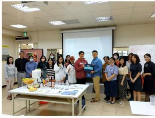
新竹新竹高工全體研習會合影