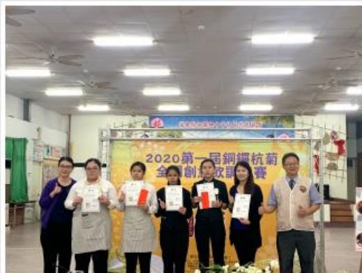
新開天訂酒師開場 (中) 與評審團開場 (右3) 頒發全國大賽頒獎券