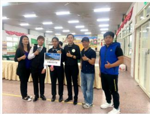
中國科大與香港科技大學合照