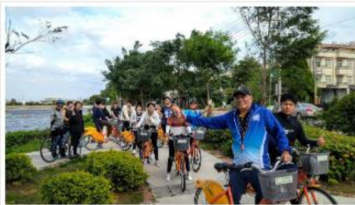
UBike自行車服務站位於歐亞水務中心