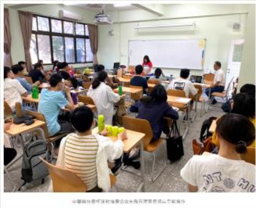
中國輔仁大學社會服務與社區發展中心與台灣社會服務中心合作