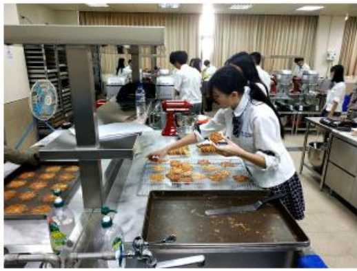
進駐之流行烘焙UP製作