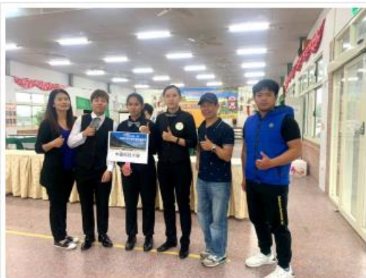
中國科大專業師生合影