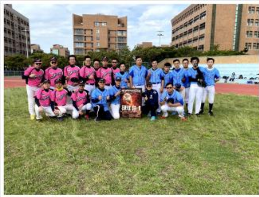
中國科大JFC俱樂部全體隊員與在校女棒隊合影