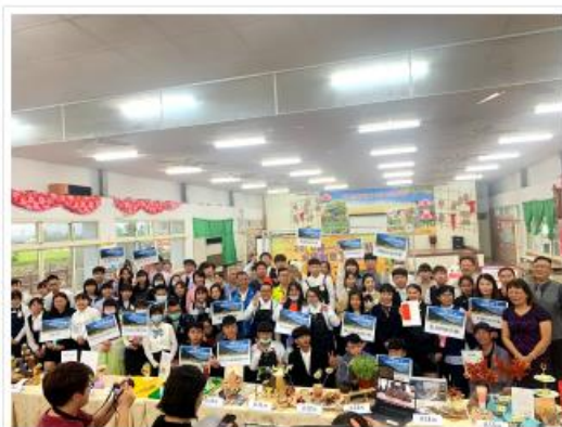
全體專業師生合影