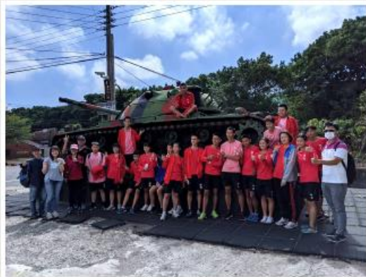
湖口高中師生於湖口鎮觀音山廟合照