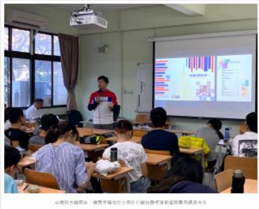
中國科大服務人員、經濟學系與社會工作系社會服務與社區發展中心合作