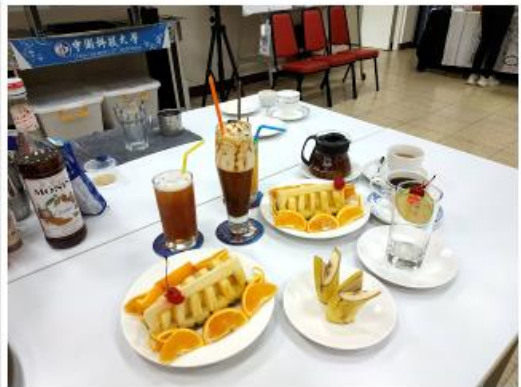
新竹國科中心資訊中心製作