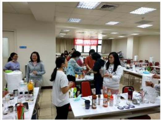
新竹新竹高工全體研習會製作