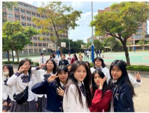
於中國文化大學校園內行政系攝影