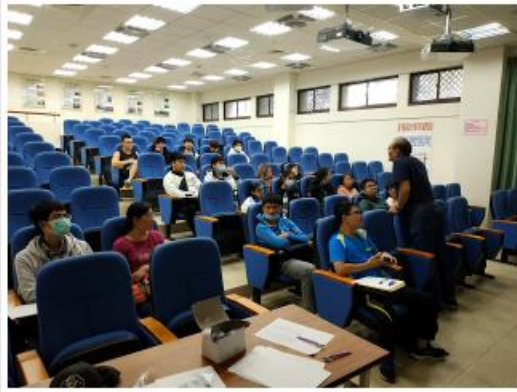
歐亞水務研究中心以行車體驗設備科研室