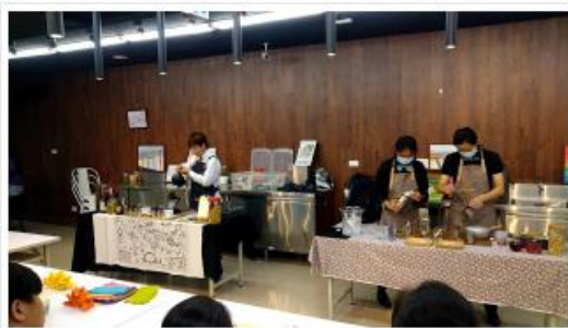
新開天訂酒師訂造場台及專業製作調酒師開場準備