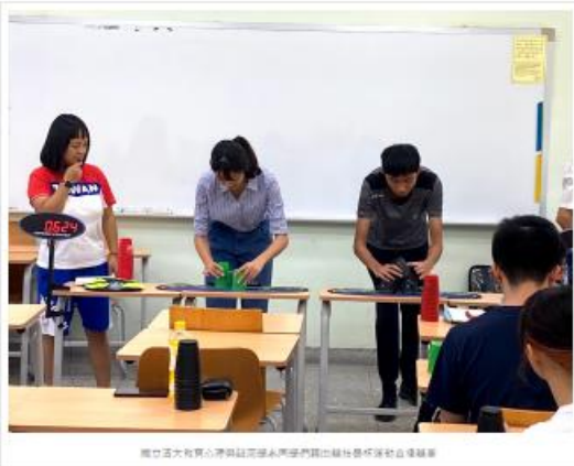
國立清華大學心理與社會學系與台灣社會服務中心合作