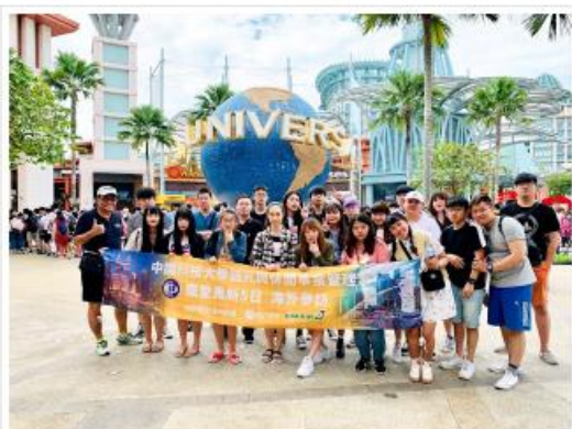
參訪新加坡環球影城體驗休閒遊憩