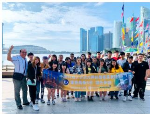
新加坡濱海灣花園體驗城市行銷