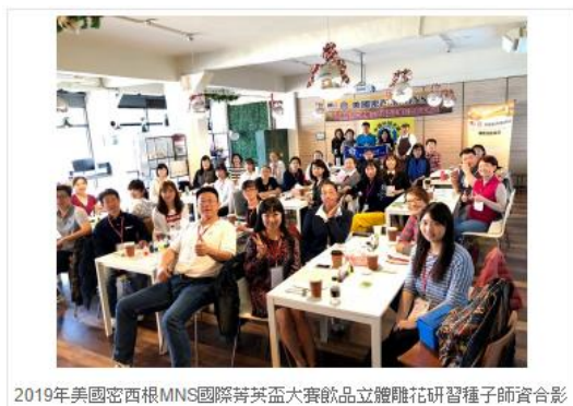
2019年美國密西根MNS國際菁英盃大賽飲品立體雕花研習種子師資合影