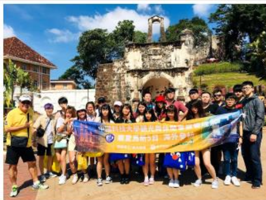
參訪馬來西亞是世界文化遺產馬六甲古城