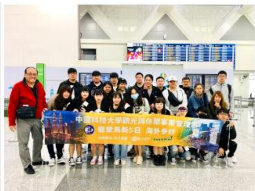
中國科大觀管系海外參訪團於桃園國際機場學習通關實務