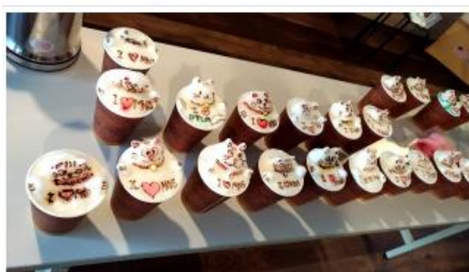
參與種子教師咖啡飲品立體雕花成果