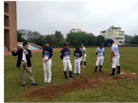
中國科大俞校長陪同中國科大棒球社社員與清華高中棒球隊球員一同檢視場地