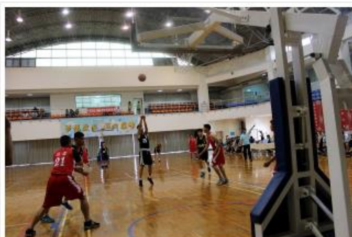
大誠高中籃球球技表現出HBL水準