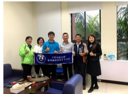
林議員（右2）田主任（右3）與中國科大教師於青年事務中心合影