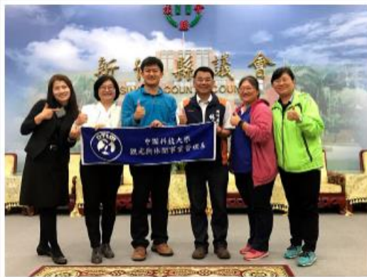
林議員與中國科大教師於新竹縣議會合影