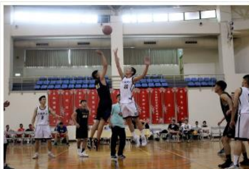
中國科大兩校區籃球隊競賽跳球