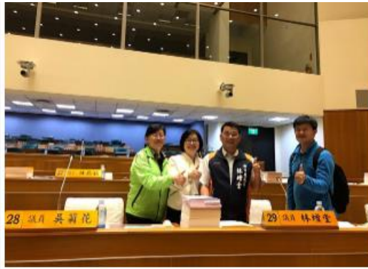
林議員於諮詢議會必須做足功課來理性問政為縣民服務