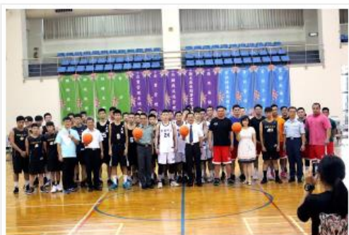
國軍×大學×高中4強籃球賽開幕合影