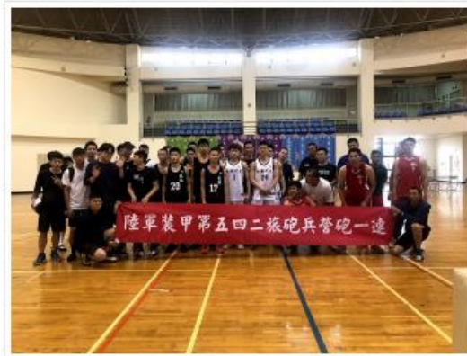
國軍542旅砲兵營砲一連蒞臨現場加油