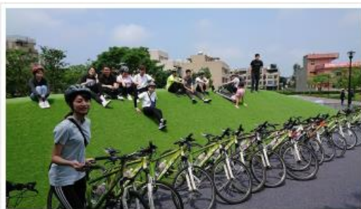
桃園富岡青旅行領騎進行地景藝術導覽解說

本次戶外實務自行車領隊訓練課程，新竹校區特別結合2018富岡地景藝術節路線與地景進行領騎訓練與導覽解說，台北校區則結合碧潭風光明媚景點予以實作訓練，在紮實的學科與樂趣化的實務自行車領隊研習課程，成就學生在觀光休閒專業領域更上一層樓。