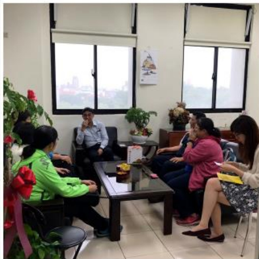
至新竹縣交通旅遊處拜會游處長（中）與許科長（右1）