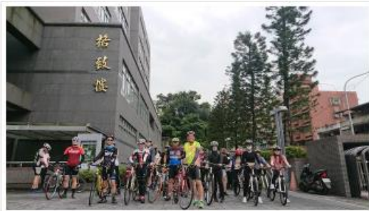
中國科大台北校區自行車設定與整隊