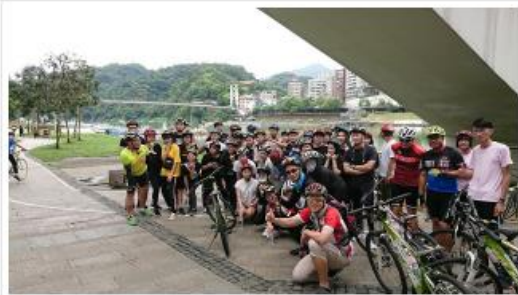
戶外實務操作 BIKE FUN 新北碧潭景點