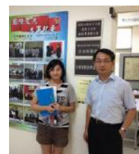
台灣國際教育協會