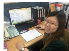
CHAN HAO 展昭展覽網 Chan Chao Exhibition Hall